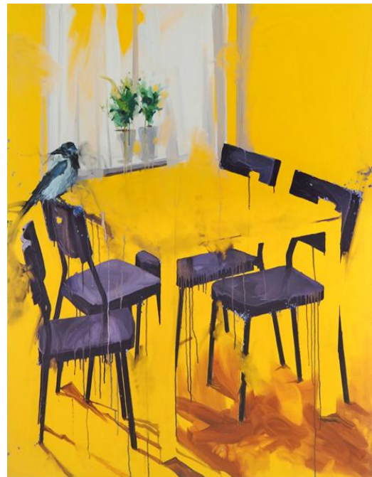
אקריליק ושמן על בד, 134x118 ס"מ, 2012