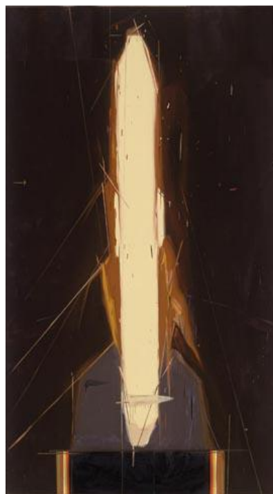
אמיר, שמן על בד, 109x170 ס"מ, 2005

ב-2008 - הציג תערוכת יחיד בגלריה טבי דרזנר בתל אביב שנקראה "הבן של חנה ומוישה", בה הוצגו ציורים של אנשים ששברו שיאים בתחומם. בשונה מציורי הדיוקן, הדימויים בסדרה זו היו בעלי מטען רעיוני דרכו התגלה המתח שבין הנושא המצויר לבין ההחלטה לצייר אותו. מתח זה נבע מכך שהמכנה המשותף בין אותם אנשים לא היה רק הצלחתם יוצאת הדופן בתחומם אלא שזו היתה הצלחה בתחומי עיסוק אזוטריים וחסרי תכלית על גבול הגרוטסקה. המפגש בין הגרוטסקה לבין הציור יצר את הדיאלקטיקה שבין העמדה הביקורתית של האמן כלפי התרבות המערבית המעודדת מרדף אחר הצלחה לבין המחויבות שלו כאמן לשבור שוב ושוב את השיא של עצמו תוך כדי שהוא מצייר. הציורים מתאפיינים בזוויתיות פוסט קוביסטית. שאריות של קווים ונזילות מתחילים להשאיר עקבות של תהליך עבודה, הפירוק של הגוף הופך להיות קונסטרוקטיבי יותר.