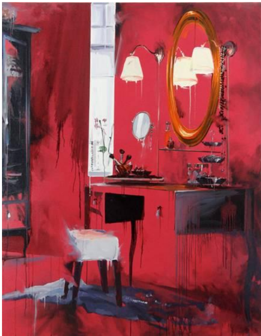
אקריליק שמן על בד, 174x134 ס"מ, 2011