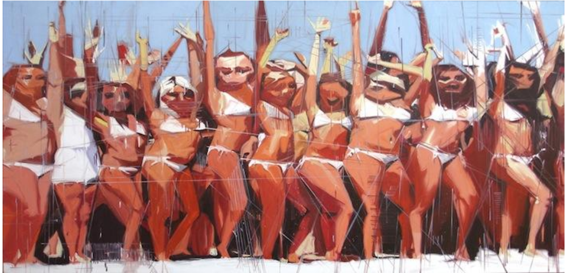
שמן על בד 123 x 254 ס"מ, 2008

בשנים האחרונות יצר רן סדרות של ציורים שבהם נראים חללים ביתיים שנדגמו מתוך קטלוגים של איקאה. חללים וחפצים אלה הפכו לזירת התרחשות שבה הסביבה האנושית ריקה מאנשים והציור מחבל בדימוי המקורי, מוחק, מטשטש ומורח אותו. "פעולות ציוריות אלו מערערות את האיזון והשלווה והופכות את הציור למרחב נפשי מאיים ומנוכר, המשרה תחושה של סכנה וחוסר נוחות" 1 . ציורים אלו הוצגו בתערוכת יחיד בגלריה 121 בתל אביב, ביריד צבע טרי בתל אביב, ובגלריה העירונית כפר סבא.