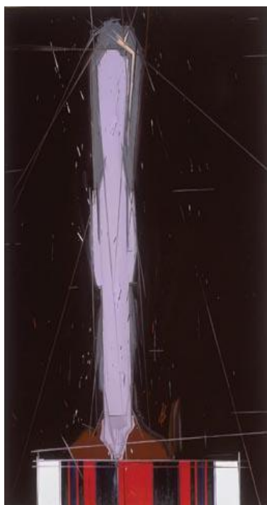
אביב, שמן על בד, 104x165 ס"מ 2005

ב-2002 - חזר רן לבית יצחק ויצר סדרת ציורי פורטרט של כמה מחבריו. בסדרה זו ניגש רן אל נושא מסורתי בציור, ציור הדיוקן, תוך ניסיון למצוא את גבולות ההגדרה הציורית של מושג זה. עד כמה הפיגורטיבי יכול להצטמצם למינימום ועדיין להכיל קווי דמיון לאדם המצויר. חיפושו אחר הדרך לצייר את דיוקנאות חבריו היווה את החיפוש אחר דיוקנו של הציור שלו, או במילים אחרות, ממה מורכבת השפה הציורית או פני שטח הציורים שלו כצייר שחי היום.